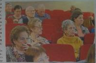
Público asistente a las jornadas momentos antes de dar inicio las ponencias.