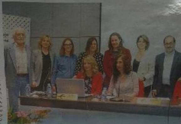
Participantes en la jornada sobre Bioética para la Ciudadanía

HUESCA. El consentimiento informado, voluntades anticipadas y otras cuestiones relacionadas con la enfermedad y sus tratamientos se abordaron ayer en Huesca en la jornada bioética para la ciudadanía. La sesión tuvo como objetivo dar a conocer el Comité de Ética Asistencial del sector Huesca, un órgano consultivo al que pueden acudir profesionales y ciudadanos.